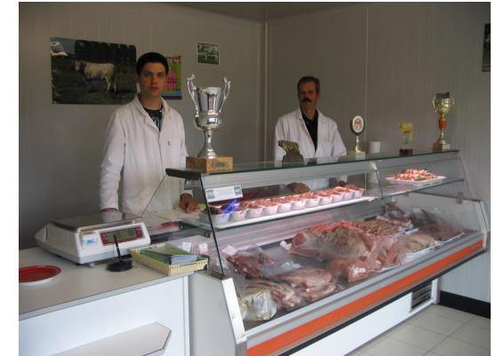
Magasin agréé par les services vétérinaires et sanitaires

La vente directe de viande en magasin a débuté 2006